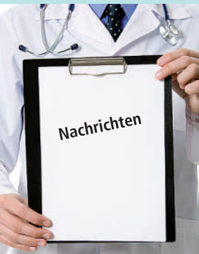
Neues aus der regionalen Gesundheitsbranche